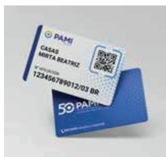
Credencial plástica nueva