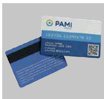
Credencial plástica anterior

Sí, actualmente existen 3 tipos de credenciales de afiliación válidas: digital, plástica y provisoria. Desde cualquiera de ellas se puede validar la prestación escaneando el código QR.